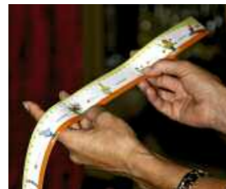
Was zählt, ist die Zukunft

seines Besitzes nicht sicher. Der Arbeiter ist mit seiner Lage unzufrieden. Das Berufsleben ist voller Enttäuschungen, vielleicht ist kein Jahrhundert mehr durch Unglück gekennzeichnet als unseres – auch dieses Statement