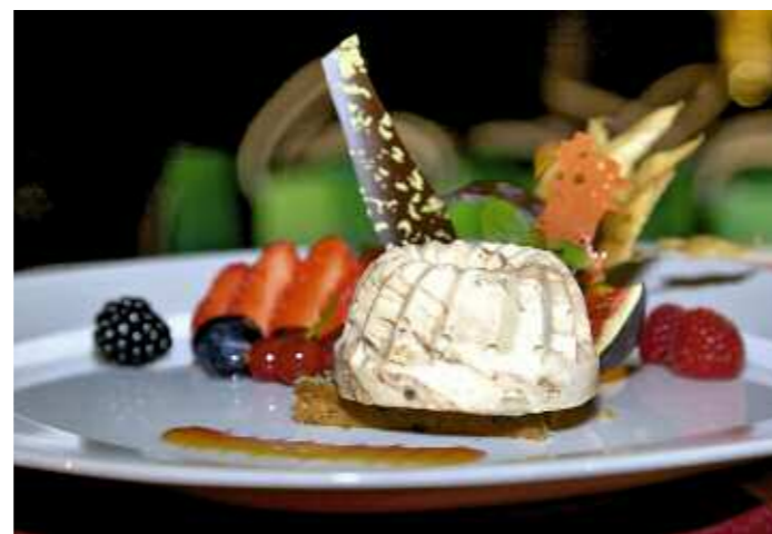
Cooler Star des Abends: Eisgugelhupf von Hügli

sierte (mit optimistischen 100 Jahren) den Lebenslauf eines Menschen. Fedrigotti: „Und nun knicken sie bitte das Maßband bei jener Zahl, die ihrem Alter entspricht. Gut. Und nun reißen