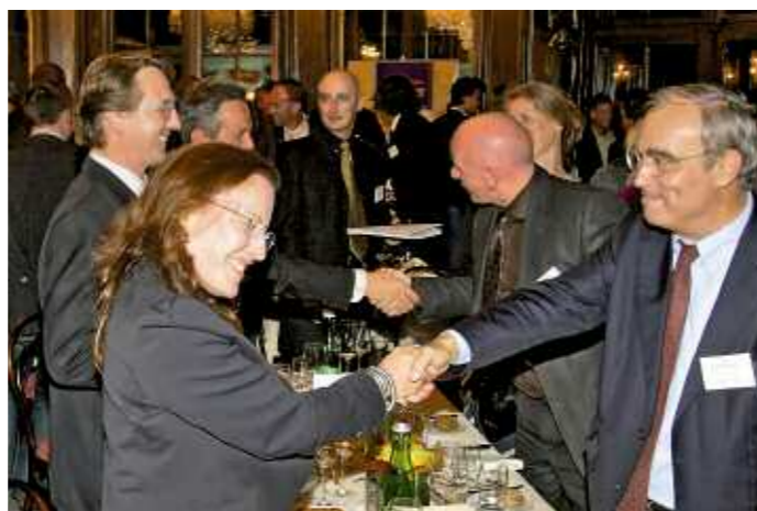
Teil des Fedrigotti-Vortrages: Sieger gratulieren Siegern

„Wir leben in einem unglücklichen Zeitalter. Der Kapitalist ist