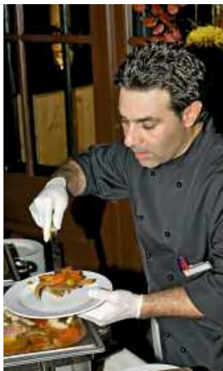
Perfektes Service der Crew