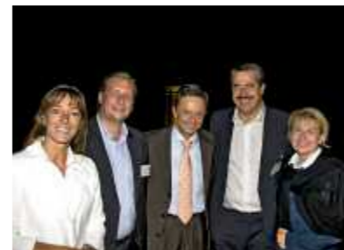
Veranstaltung war ausgebuht, Gäste und Organisatoren happy

Fedrigotti definiert Erfolg unter anderem mit „ein Ziel, das man sich gesteckt hat, zu erreichen – und dies beginnt im Kopf“. Wer