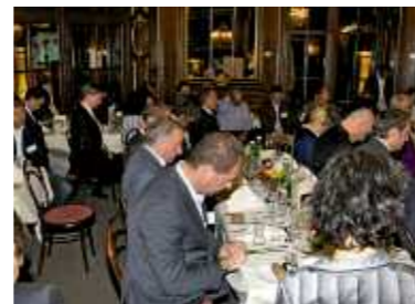
„Erschlaffen“ auf Befehl

stammt nicht aus dem Jahr 2009, sondern wurde 1897 in der Zeitschrift New Englander veröffentlicht. Zum Abschluss bekam jeder Gast ein Maßband aus Papier in die Hand gedrückt. Es symboli-