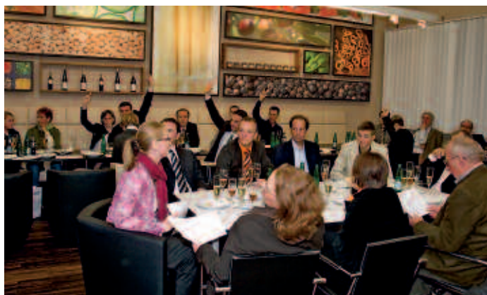
Ein exklusiver Rahmen: Der neue Verkostungsraum der Pasteten-Manufaktur Hink in Wien-Floridsdorf