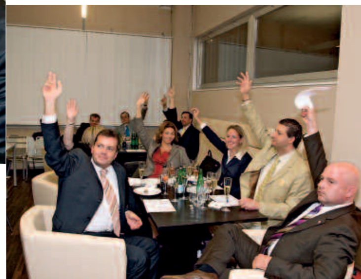
Bereits Tradition: Votum durch Handheben

Allein auf diese Art die Mitarbeiter zu leiten, bedeutet ständiges Führen, Kontrollieren und Zwingen. Wer hat die meiste Arbeit? Natürlich die Führungskraft. Es gibt jedoch auch die Theorie Y, wonach jeder Mitarbeiter von Natur aus leistungsbereit und von innen her motiviert ist. Man muss also nur die richtigen Rahmenbedingungen schaffen und die Mitarbeiter haben Spaß an der Arbeit. Der Füh-