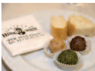
Die hervorragenden Gänse- und Entenleber-Pralinen

verschiedenen Persönlichkeitstypen und deren Auswirkungen auf Teamleistungen. Je nach Stärken, Neigungen und Schwächen ordnet er den Mitgliedern eines Teams neun unterschiedliche Rollen zu. Laut Belbin arbeitet dann ein Team am besten, wenn es aus einer Vielzahl heterogener Persönlichkeits- und Rollentypen besteht. Für die