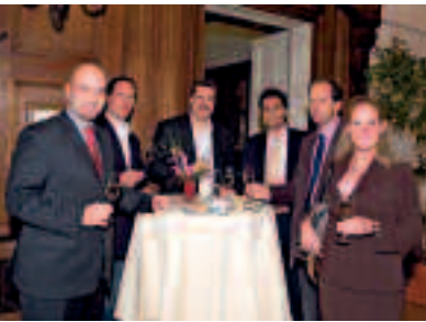
Das Hotel Parkschlössl war der schlichtweg ideale Rahmen für diese Veranstaltung