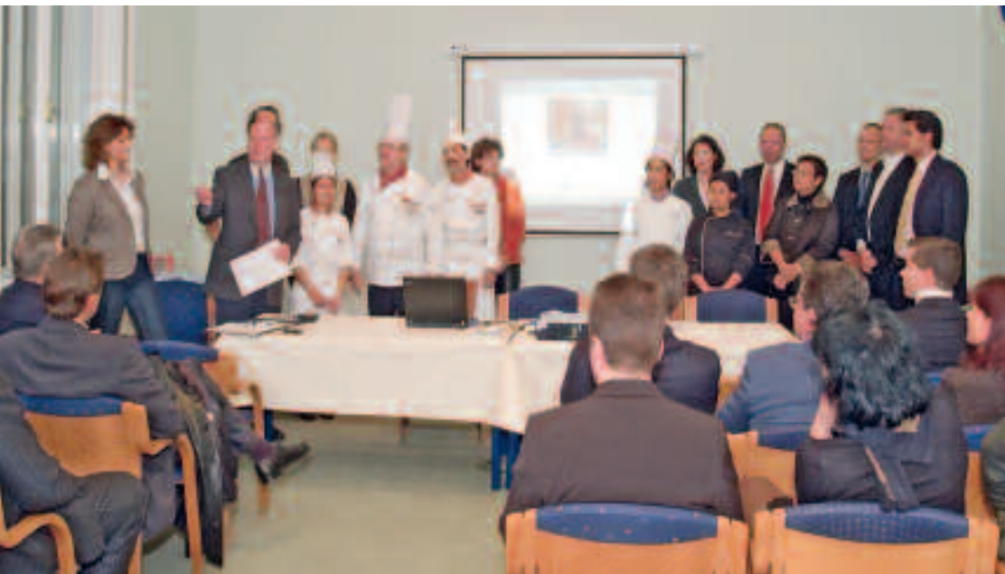
Eine große Anzahl an Helfern und Referenten betreute an diesem Abend die Gäste