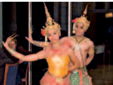
Die thailändischen Schauspieler und Tänzer